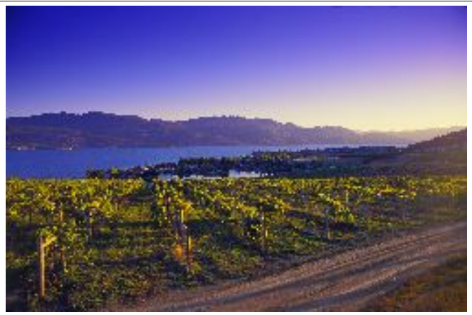
Vignobles près de Kelowna

Au-delà des images qui composent les paysages de cette belle région Thompson-Okanagan, que sont les lacs, les vallées, les vignes, les vergers et les ranchs, se dessine l'histoire d'un peuple, et celle, entre autres, des pionniers francophones du Canada et de l'Europe, présents dans ce coin du monde dès la deuxième moitié du XIX e siècle.