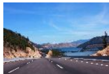
Route entre Merritt et Kelowna