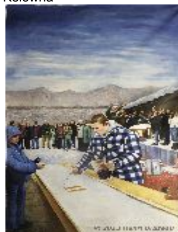
Murale du CCFO