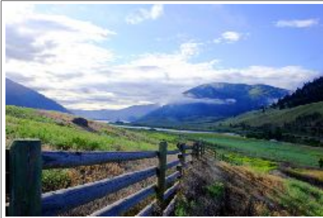
Nicola Ranch - Merritt