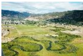
Vue de Merritt