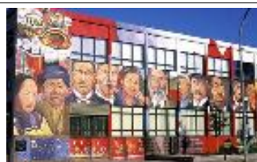
Murale - Vernon

Dîner au restaurant Terra et nuit à Kamloops à l'hôtel South Thompson Inn , situé en pleine nature, au bord de l'eau.