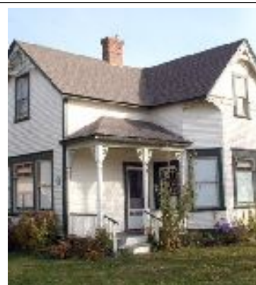
Baillie House – Merritt

Nuit à Kelowna à l'hôtel Comfort Suites ou similaire.