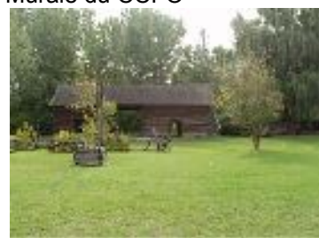
Mission du Père Pandosy-Kelowna