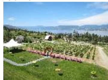
Summerhill Pyramid Winery-Kelowna