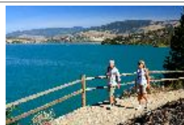
Kalamalka Lake - Vernon