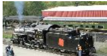
Kamloops Heritage Railway