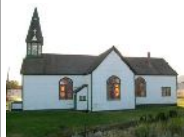
Église St Joseph - Kamloops