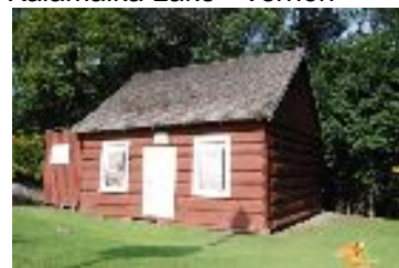
Girouard Cabin – Vernon