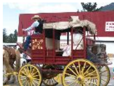
Historic O'Keefe Ranch