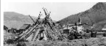
Parc Secwepemc – Kamloops