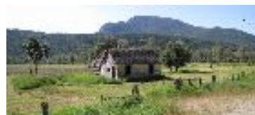
Paysage de Lumby