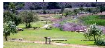
Parc Secwepemc – Kamloops