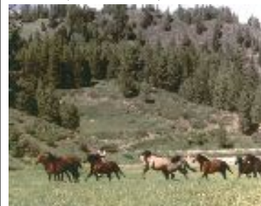
A-P Ranch - Merritt