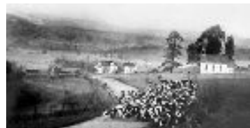
Historic O'Keefe Ranch