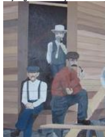
Murale de Lumby